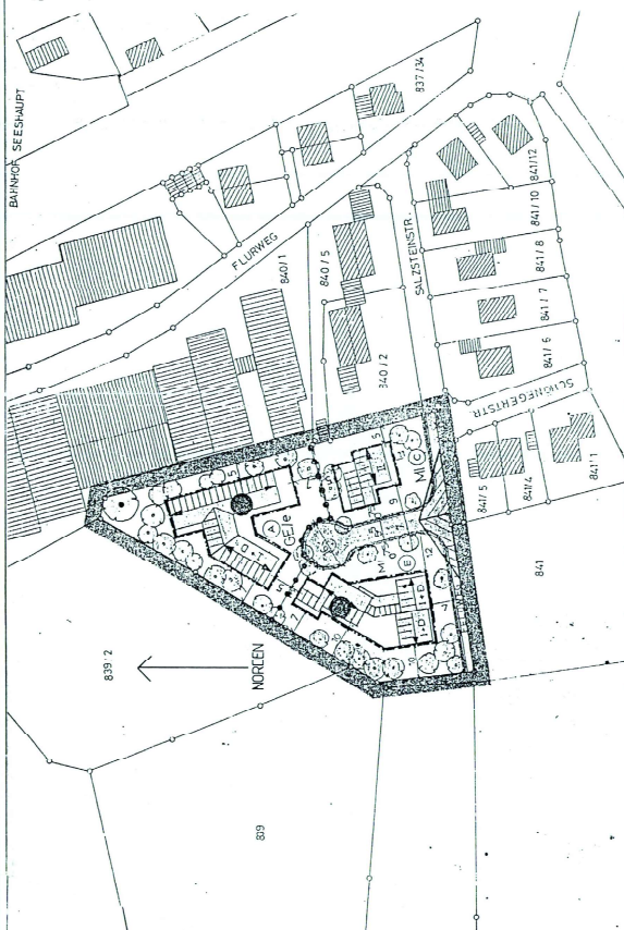
AUS DEM RECHTSVERBINDLICHEN BEBAUUNGSPLAN "NÖRDLICH DER SALZSTEINSTRASSE" DER GEMEINDE SEESHAUPT M = 1:1000

Seeshaupt, den 10.07.95 Hans Hirsch 1. Bürgermeister