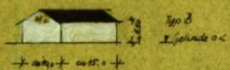
Typ B I. Gehände o.c.