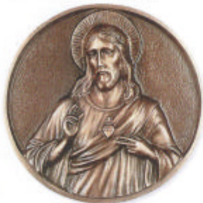
»Herz Jesu« 12 cm ø, 1 cm tief