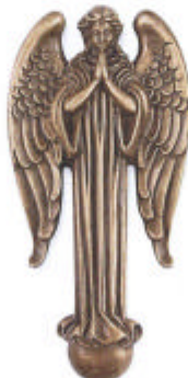
»Engel« 11x5x1 cm