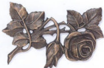
»Rosen« 10x15 cm ◀ 10x15 cm ▶