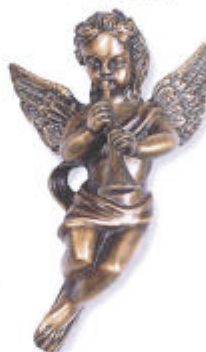
»Engel« 11x7x4 cm ◀