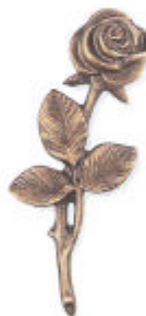
»Rose« 10x4x1 cm ▶