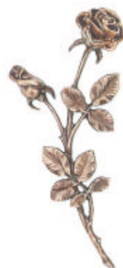
»Rosen« 20x8x2 cm ◀ 20x8x2 cm ▶