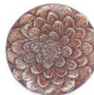
»Blüte« 5 cm ø, 1 cm tief Sonderpatina