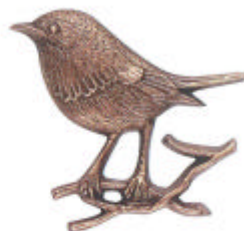
»Rotkehlchen« 6x6 cm