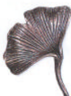
»Ginkgoblatt« 9x9 cm