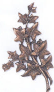
»Efeu« 18x10 cm