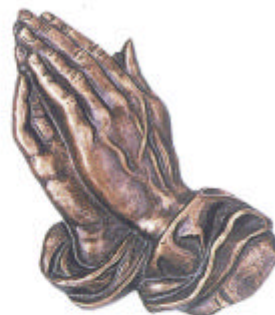
»Betende Hände« 11 x 6 cm ◀ 11 x 6 cm ▶