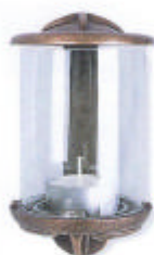
Wandlaterne 14 cm h