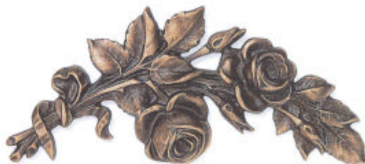
»Rosen« 10x24 cm ◀ 10x24 cm ▶