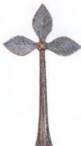
»Kreuz« 15x8x2 cm Sonderpatina