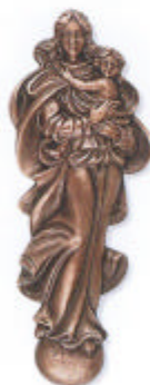
»Madonna mit Kinde« 11x4x1 cm