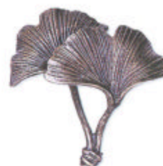
»Ginkgoblatt« 11x11 cm