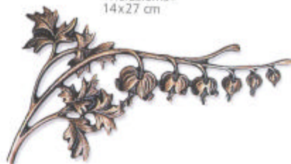
»Herzblume« 14x27 cm