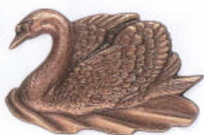
»Schwan« 5x8 cm