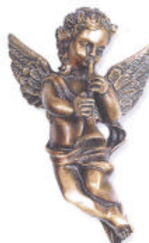
»Engel« 11x7x4 cm ▶