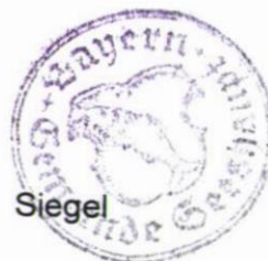
Kirner 1. Bürgermeister