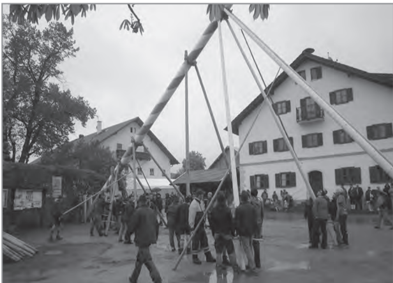
Mit vereinten Kräften ...

konnte sich jeder über verschiedene Brände und deren Herstellung informieren und natürlich probieren. Bei kühlen Temperaturen fachsimplen Kenner und die, die es noch werden wollen. mb