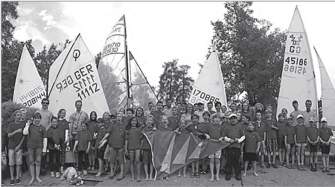
Begeisterte Teilnehmer, Foto: privat

Pfingstferien: 56 Kinder schnuppern im Yacht-Club Seeshaupt