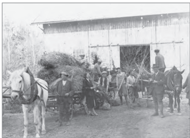
Mit Pferdefuhrwerken wurden die Pflanzen geliefert