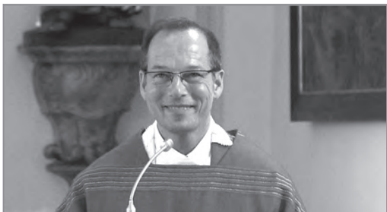
Der strahlende Jubilar