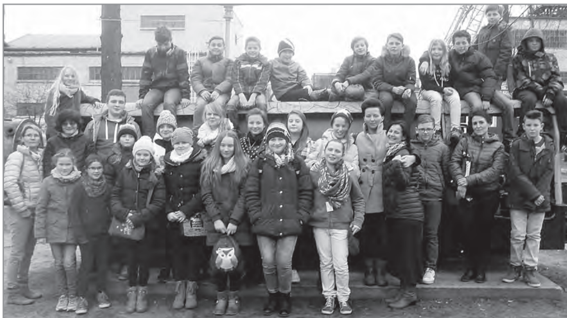
Alle Kinder zusammen ergaben eine ganz schön große Gruppe - bei der Besichtigung des Steinkohlebergwerks in Zabrze konnten gar nicht alle auf einmal in der kleinen Bahn durch die Tunnel fahren, Foto: dz