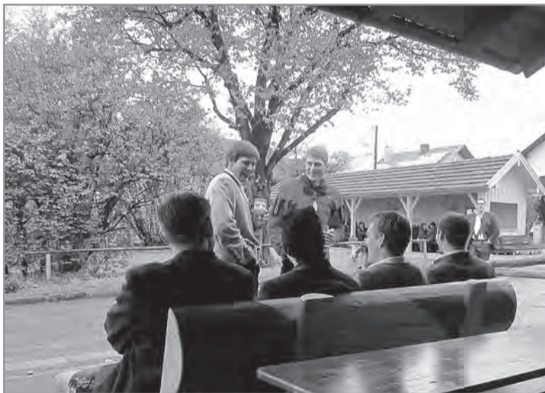
...zum gemütlichen Teil