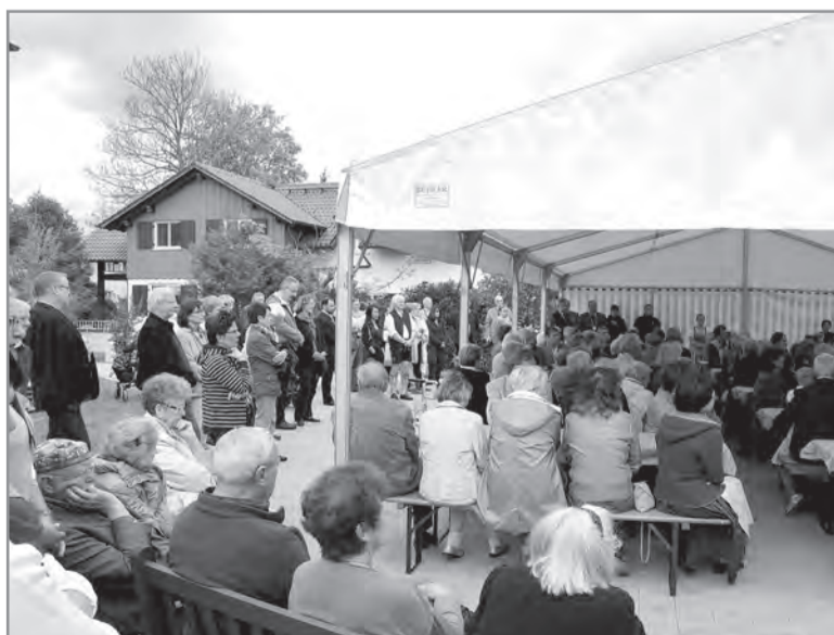
Viele Gäste kamen zur offiziellen Einweihung