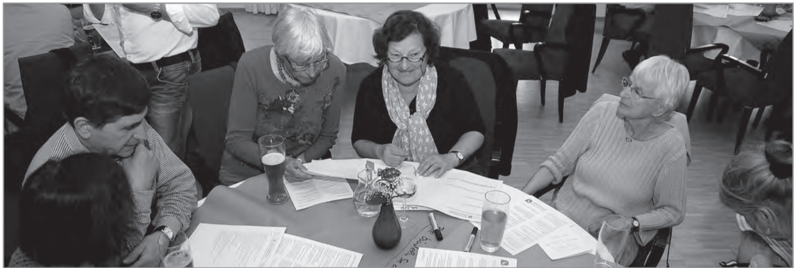
Angeregte Diskussionen entspannen sich an den Tischen

Lebhaftes Interesse an der Bürgerwerkstatt