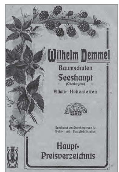
Demmel-Katalog von 1912

großer-fettweis | kollegen RECHT | MEDIATION