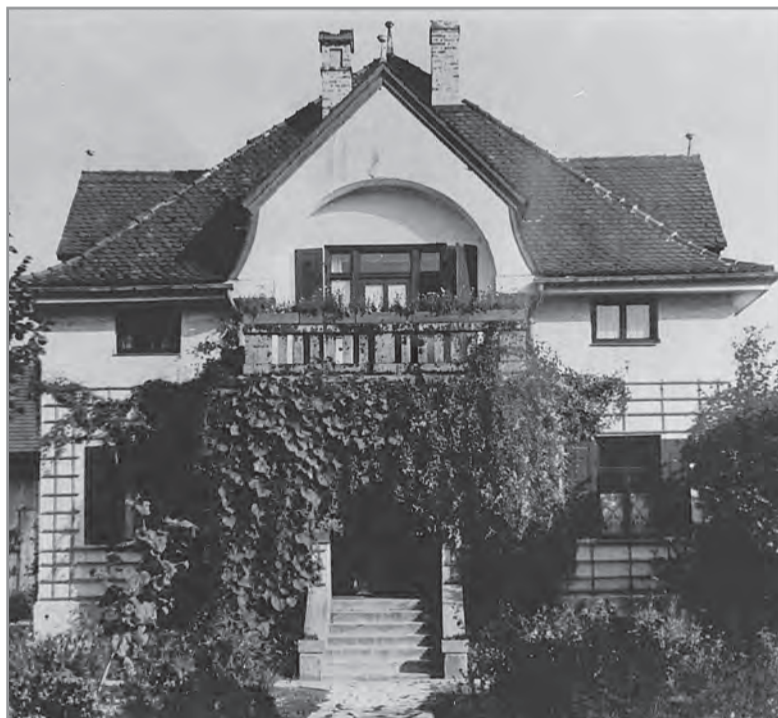
Das Wohnhaus um 1950, Architekt Xaver Kittl, Tutzing