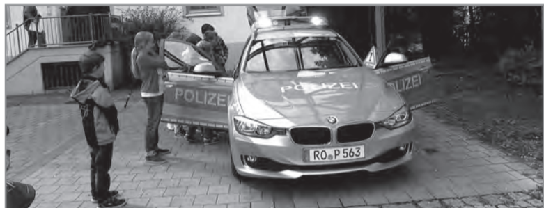
Der Besuch der Polizeiinspektion Penzberg ist eines der Highlights im Programm, Foto: db

ter und Gesang“ für die Großen, bis zum „Steine bemalen“ für die Kleinen. Dank großzügiger Spenden der Geschäftswelt sind alle Kurse wieder kostenfrei. Die Hefte mit der kompletten Kursübersicht und den jeweiligen Terminen werden ab Ende Juni im Kinderhaus, in der Schule und im Kinderstern verteilt. Zusätzlich liegen Exemplare bei Schreibwaren Brückner und der Gemeinde auf. Bis 10. Juli müssen die Anmeldebögen auf der Gemeinde eingegangen sein. Am Donnerstag, 16. Juli können die Anmeldebestätigungen auf der Gemeinde im Sitzungssaal 1. Stock von 8 bis 12 Uhr und von 15 bis 18 Uhr abgeholt werden. dz