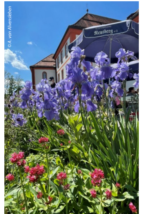
Auf dem „Radl“ lässt sich die landschaftliche Schönheit rund um Wolfratshausen mit allen Sinnen erleben.